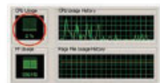
Terminalerin Ana makine üzerindeki CPU kullanımı